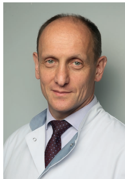
Директор ГБУЗ «МКНЦ имени А.С. Логинова» ДЗМ Академик РАН, проф., д.м.н.

Будем рады встрече с Вами на 51-й научной сессии ЦНИИГ и уверены, что наша совместная работа будет способствовать развитию новых научных связей между специалистами различных специальностей.